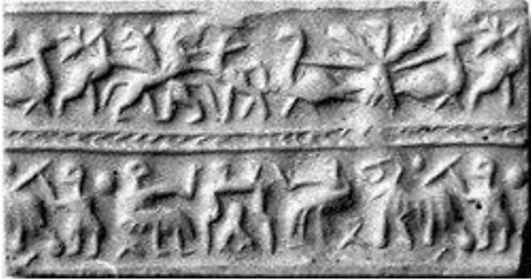
شكل رقم 14 ختم اسطواني صور فيه طائر النسر يضع مخالفه على وزنين متدبرتين