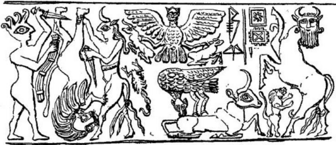
شكل رقم 11 طبعة ختم من مدينة اور من عصر السلالات