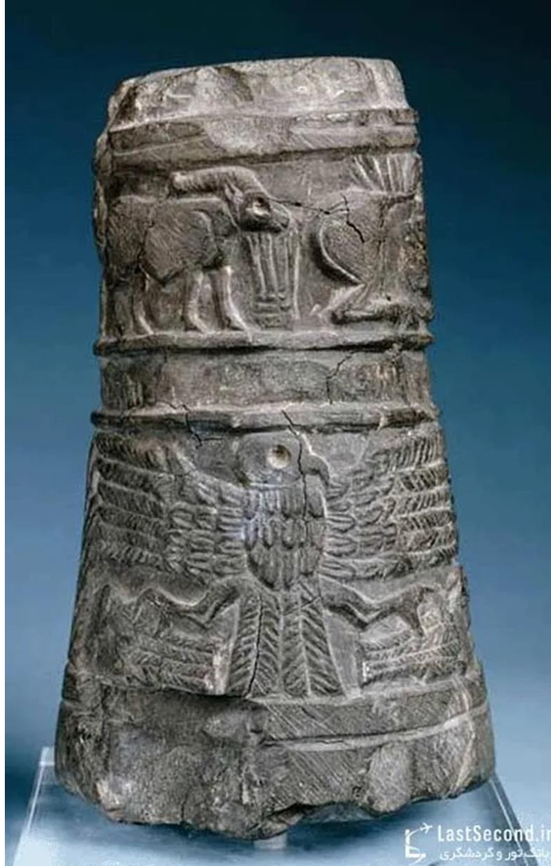
شكل رقم 15 قاعدة مخروطية حجرية من موقع سوسة