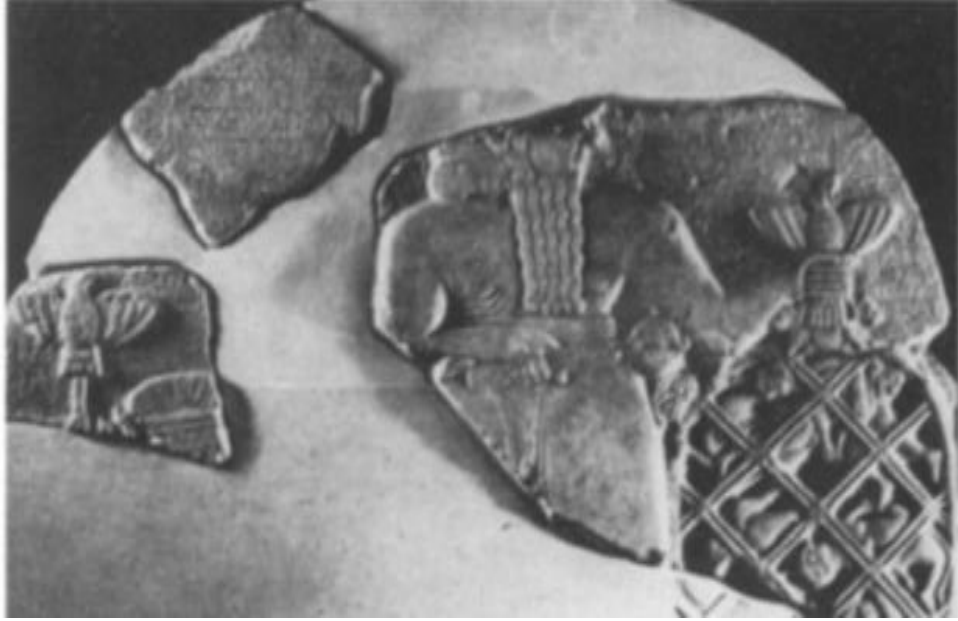
شكل رقم 12 جزء من مسلة النصور لحاكم لكش ايانام