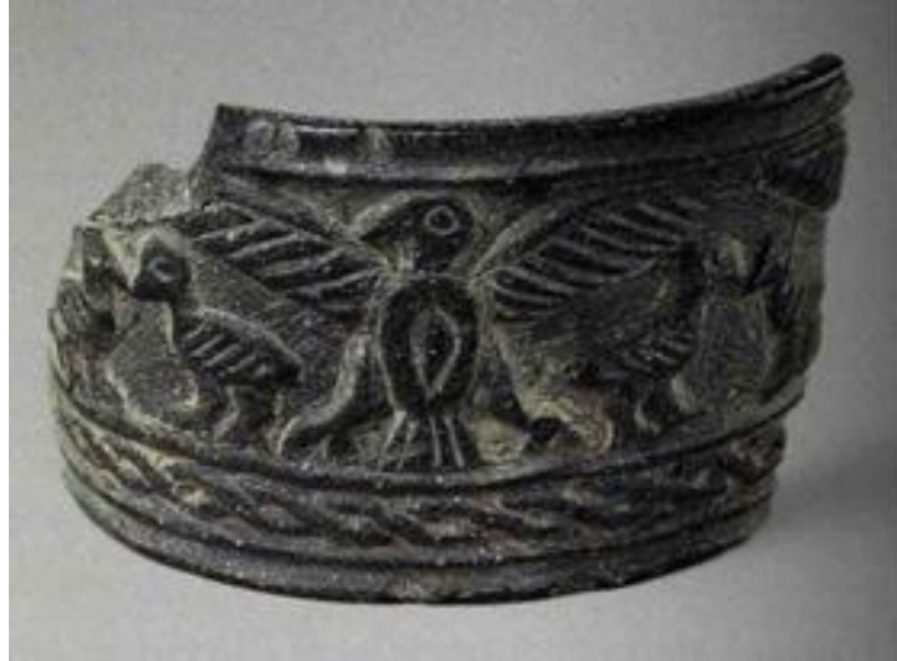
شكل رقم 13 أناء

عن المصدر: Goldsmith, N. F. and Gould, E. "Sumerian Bats, Lion-Headed Eagles, and Iconographic Evidence for the Overthrow of a Female-Priest Hegemony", The Biblical Archaeologist, Vol. 53, No. 3 (Sep., 1990), p. 150