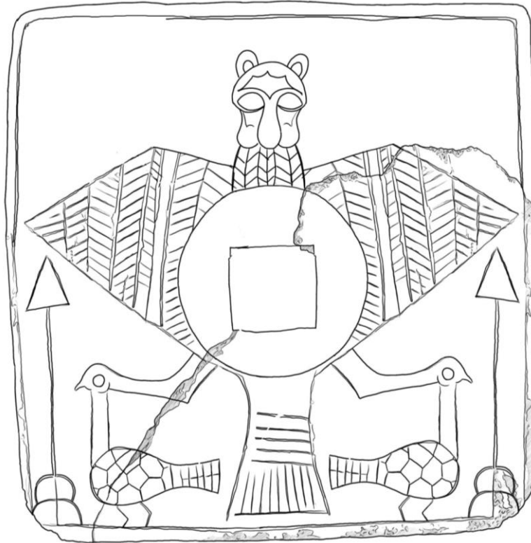
شكل رقم 2-ج رسم تخيلي للشكل الاصلي للوح النذري من تلول البقرات