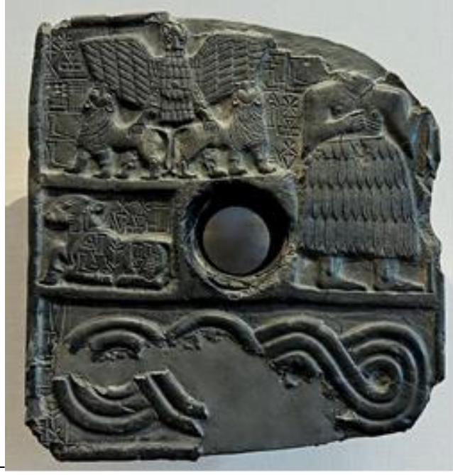
شكل رقم 5 لوح نذري للكاتب دودو من تلو

عن المصدر : مورتكات ، انطون ، الفن في العراق ... ، ص 145 ، لوح 117