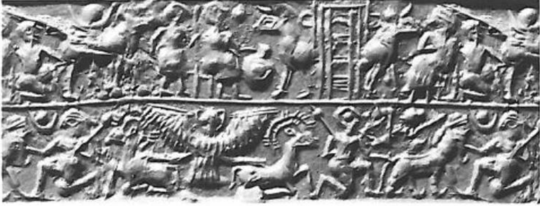
شكل رقم 10 ختم اسطواني مصدره غير معروف من عصر السلالات

شكل رقم 9-ب رسم للمشهد المصور على الاناء النذري لحاكم لكش انتمينا