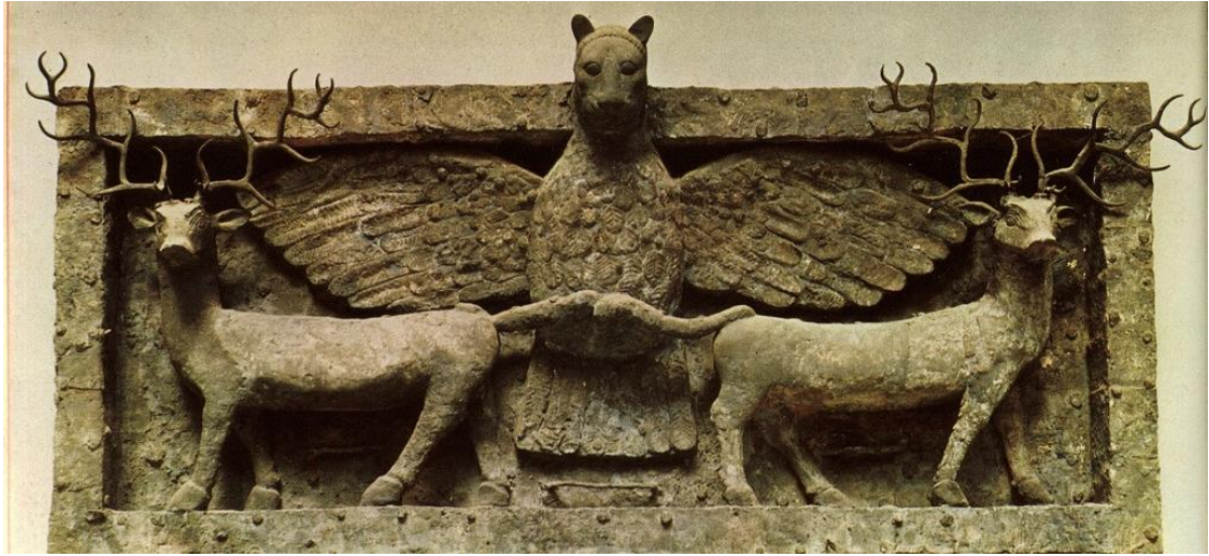
لوح من النحاس يزين واجهة ننخورساك في العبيد