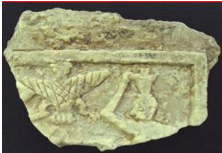
شكل رقم 4 لوح نذري من موقع أم العقارب

عن المصدر : Kalyanaraman ,S.,Animal tributs...,p. 34: