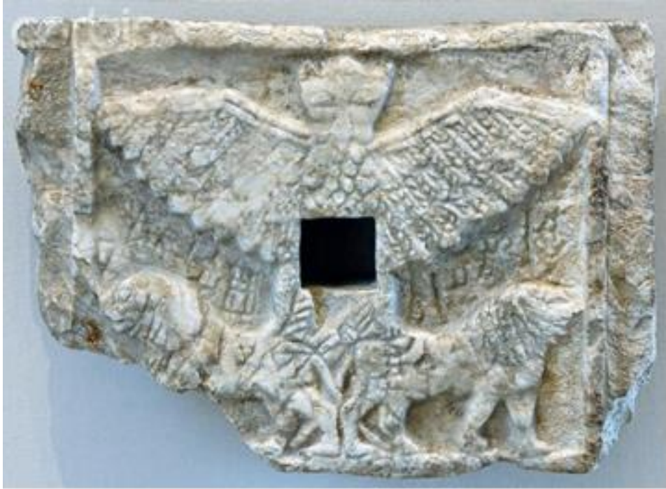
شكل رقم 3 لوح نذري من موقع لكش .